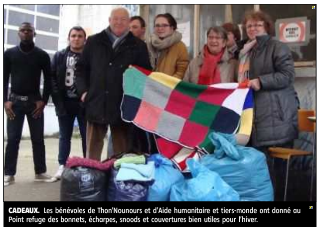
CADEAUX. Les bénévoles de Thon/Nounours et d'Aide humanitaire et tiers-monde ont donné au Point refuge des bonnets, écharpes, snoods et couvertures bien utiles pour l'hiver.

« Nous sommes une dizaine à nous retrouver mais beaucoup de personnes tricotent aussi chez elles et nous envoient leurs réalisations. L'inspiration est libre même si nous recevons beaucoup de doudous qui sont souvent tous vendus lors du Téléthon. Nous avions aussi une trentaine de paires de gants, qui ont toutes trouvé preneurs. »